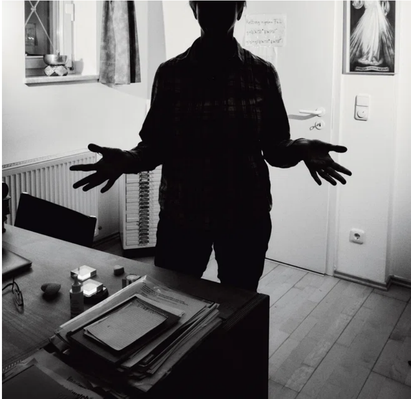
Die Mutter, hier in ihrem Arbeitszimmer, war erst Krankengymnastin, dann ließ sie sich zur Homöopathin ausbilden.

Dann kam 2015, und plötzlich war überhaupt nichts mehr lustig.