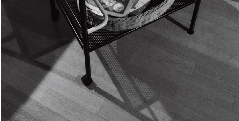
Der Teewagen, darauf ihre und seine Quellen: Die ZEIT und "Compact", ein Magazin des Kopp Verlags

Jeder in unserer Familie hat eine eigene Erklärung, woher das mit meiner Mutter kommt. Meine jüngste Schwester glaubt, es sei passiert, weil sie nach dem Auszug von uns Kindern plötzlich zu viel Zeit gehabt habe und aus Langeweile im Internet herumgesurft sei. Mein Vater glaubt, die Anschläge vom 11. September 2001 seien der Auslöser gewesen. Jedenfalls hatten sie damals zum ersten Mal richtig viel Streit.